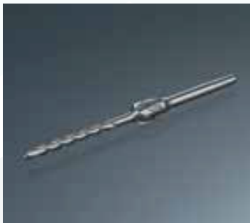
Broca escalonada EJOT página 58