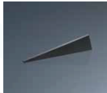
Repuestos EJOT BrocaX (extractor broca) página 58