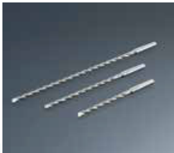
Brocas EJOT página 58

Una amplia gama de accesorios está disponible para los productos